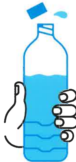
JE BOIS RÉGULIÈREMENT DE L'EAU