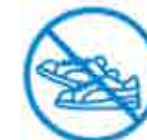
J'évite les efforts physiques