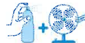
Je mouille mon corps et je me ventile