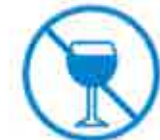
Je ne bois pas d'alcool