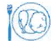
Je mange en quantité suffisante